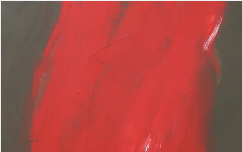
Crédit : La Colonne rouge, 100 x 100 cm, 2023 (Catherine Goursolas)