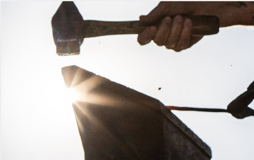
Crédit photo : Atelier de l'Arbre Lune - Forge - Forgeron (Atelier de l'Arbre Lune)