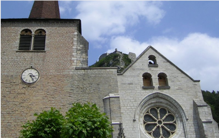
Crédit photo : SALINS - COLLEGIALE SAINT ANATOILE_1 (SALINS - COLLEGIALE SAINT ANATOILE)