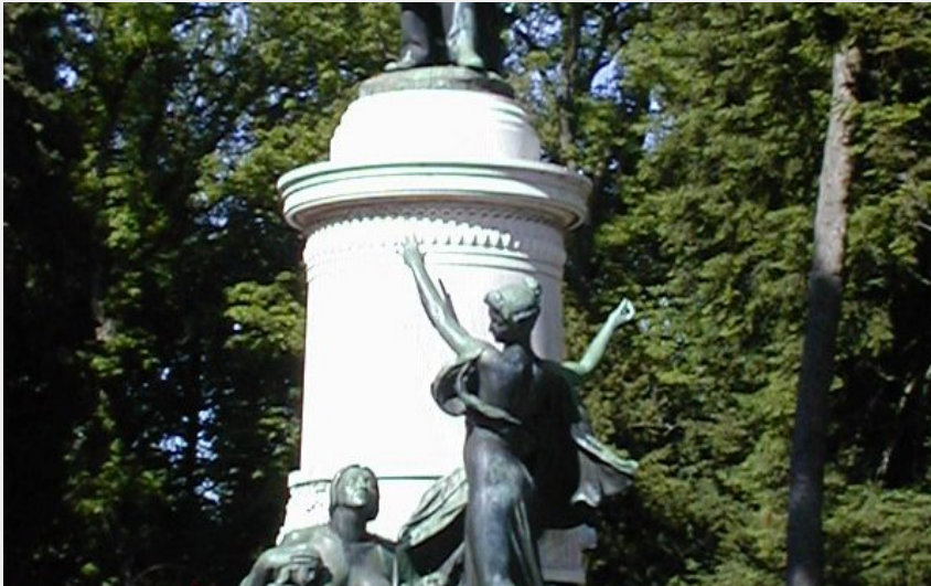
Crédit photo : JARDIN- LE COURS SAINT-MAURIS_1 (JARDIN- LE COURS SAINT-MAURIS)