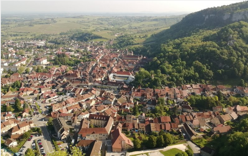
Vue de Poligny depuis la Croix du Dans