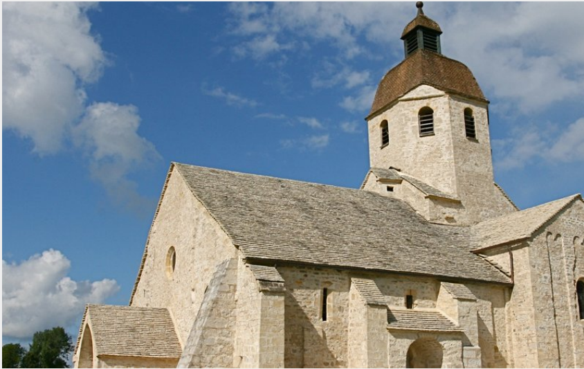
Crédit photo : EGLISE DE SAINT HYMETIERE_1 (EGLISE DE SAINT HYMETIERE)