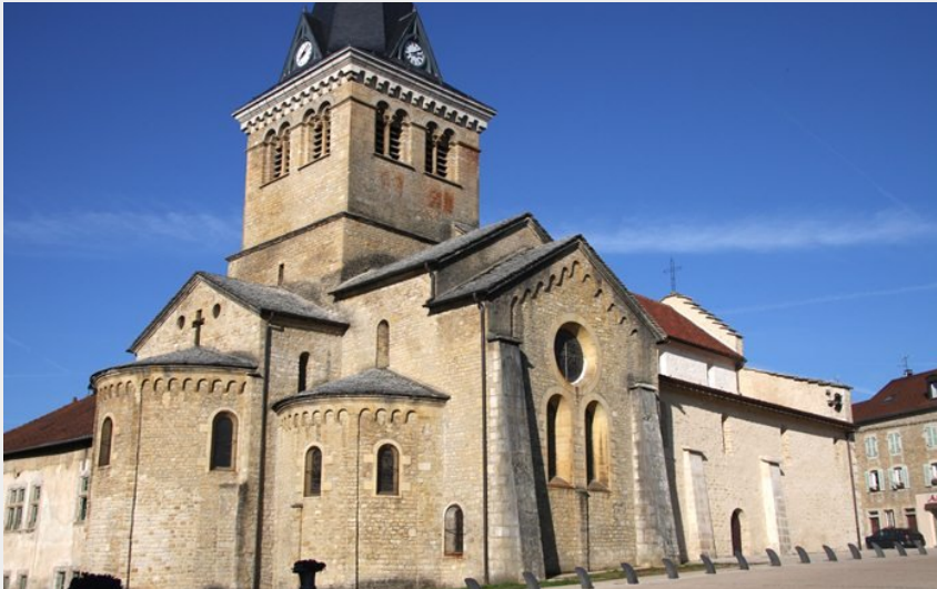
Crédit photo : EGLISE NOTRE DAME A SAINT LUPICIN_1 (Photos : Guy Millet)