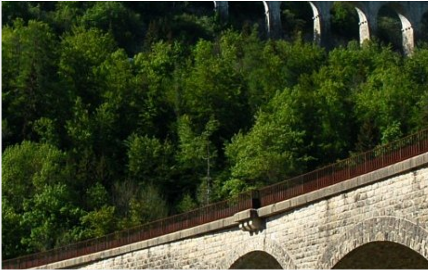
Crédit photo : La Ligne des Hirondelles - Morez - Morbier (J. Carrot)