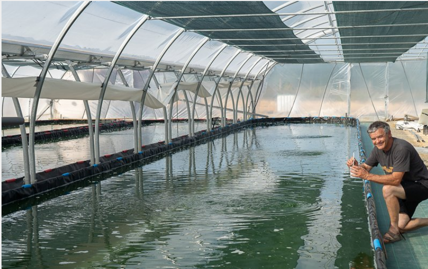
Crédit photo : Frederic Lefebvre - bassin et lui (Frederic Lefebvre)