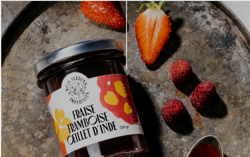
Crédit : Confiture d'exception - Nos Jardins Imparfaits (©GaranceLi)