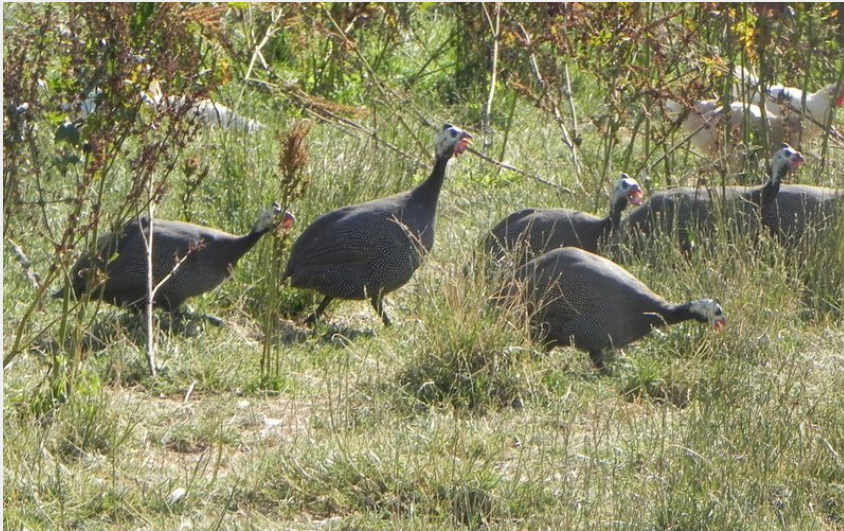
Crédit photo : Pintades - LA GRANGE ROUGE_1 (Christian Baraux - LA GRANGE ROUGE)