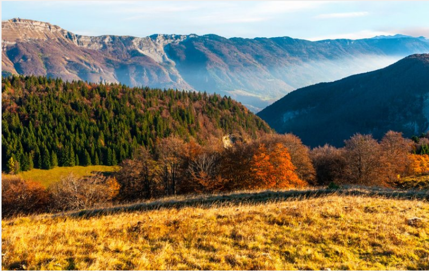
Vue depuis la Borne aux Lions - La Pesse