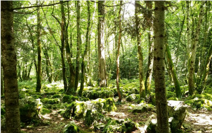
Forêt de Chaux