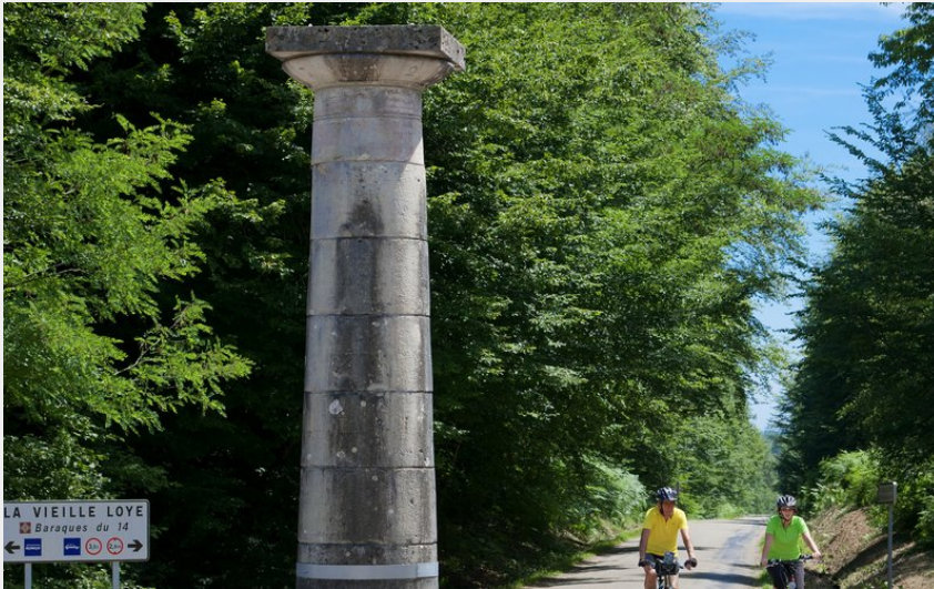
Colonne Guidon de la forêt de Chaux