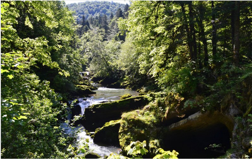
Pertes de l'Ain