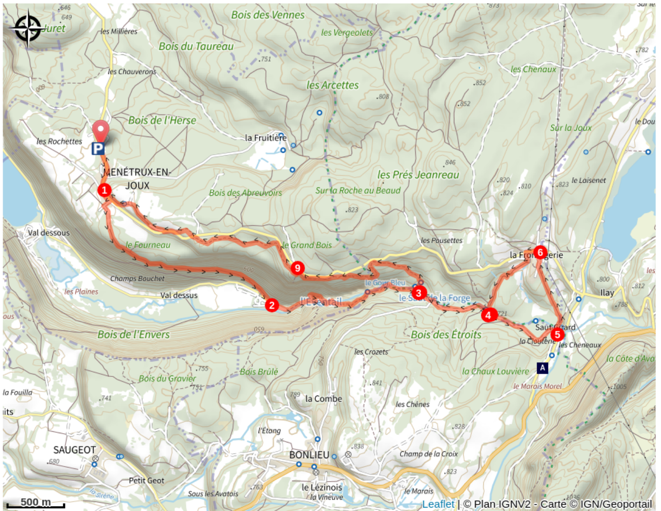
La cascade du Saut Girard (A)