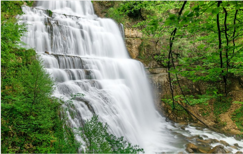
L'Eventail - Cascades du Hérisson