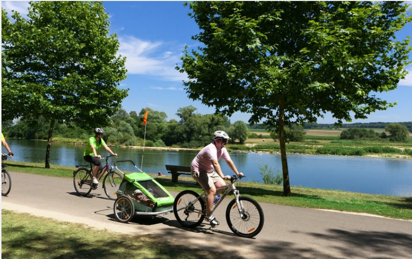
EuroVelo 6 à Rochefort sur Nenon