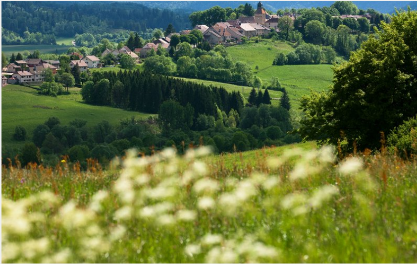
Plateau de Nozeroy