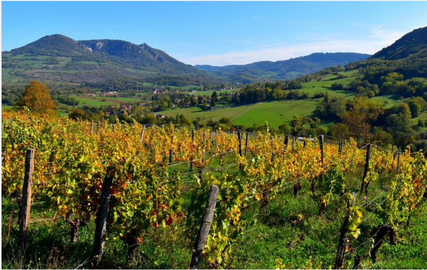
Marnoz (Nicolas Bouveret/CDT jura)