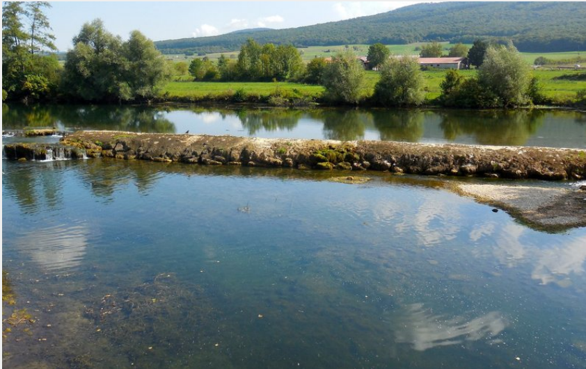
La rivière de la Loue