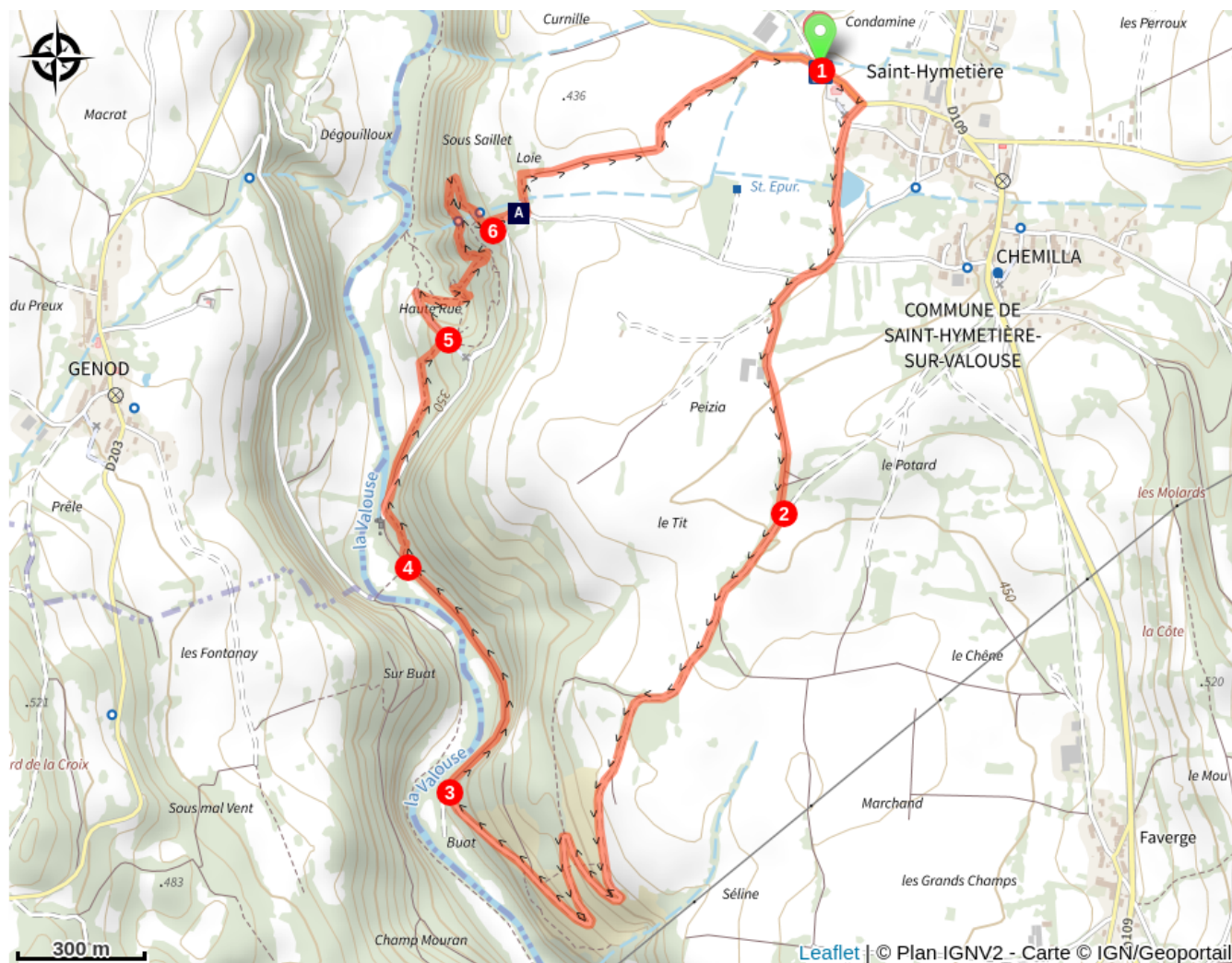
La Caborne du boeuf (A)