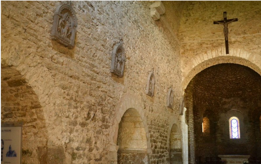
Intérieur de l'église de Saint-Hymetière