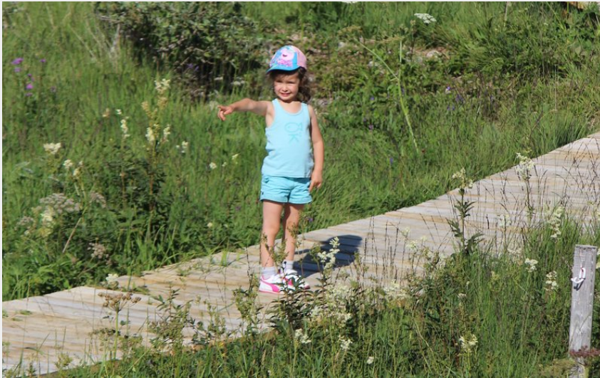
Tourbière de Nanchez (Julien Vandelle)