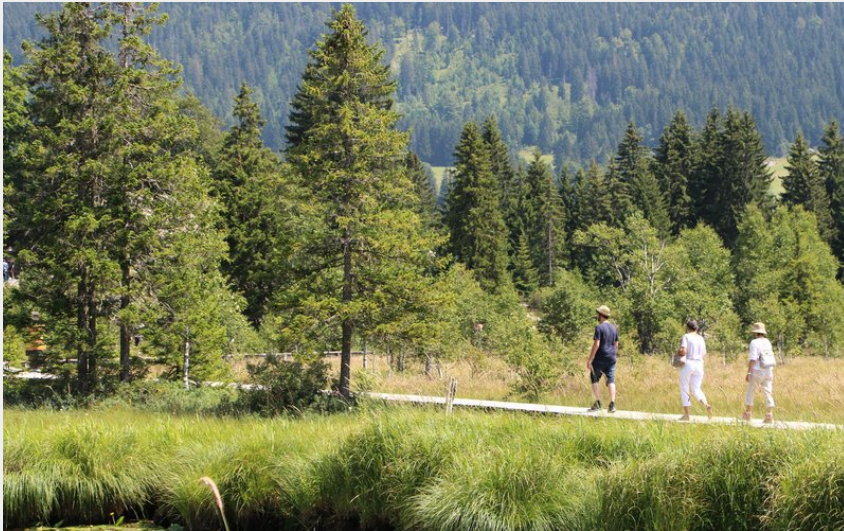
Lac des Rousses (PNRHJ / Nina Verjus)