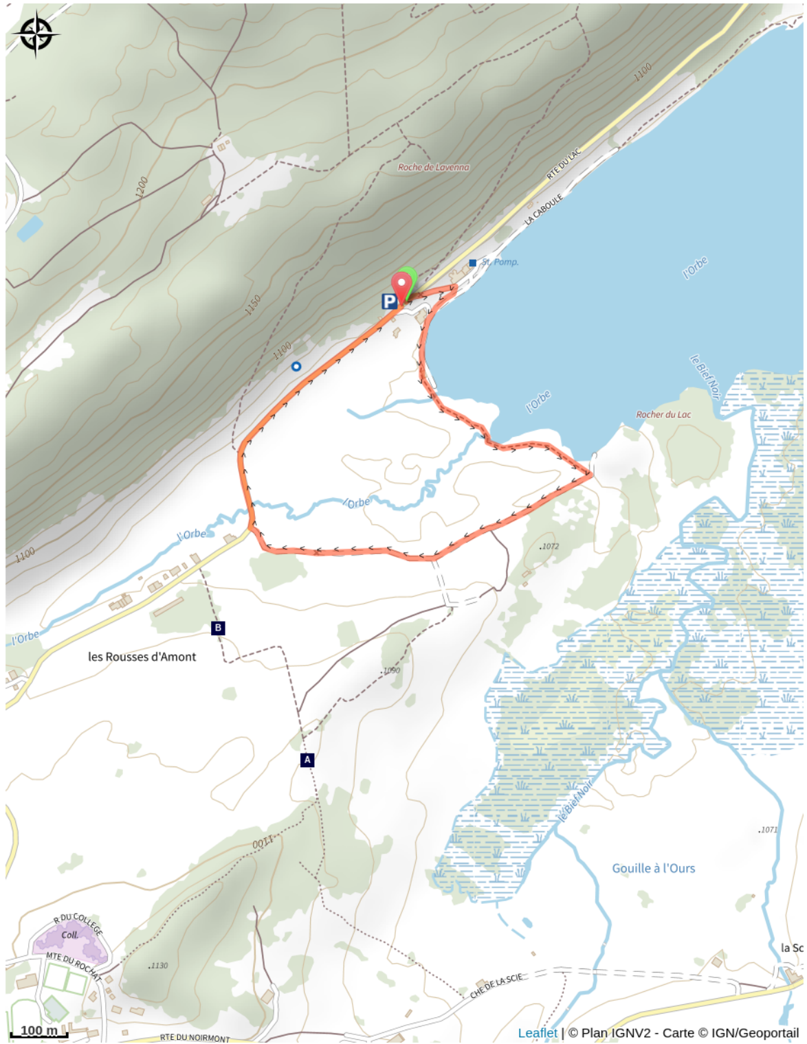
Étymologie des Rousses (A)