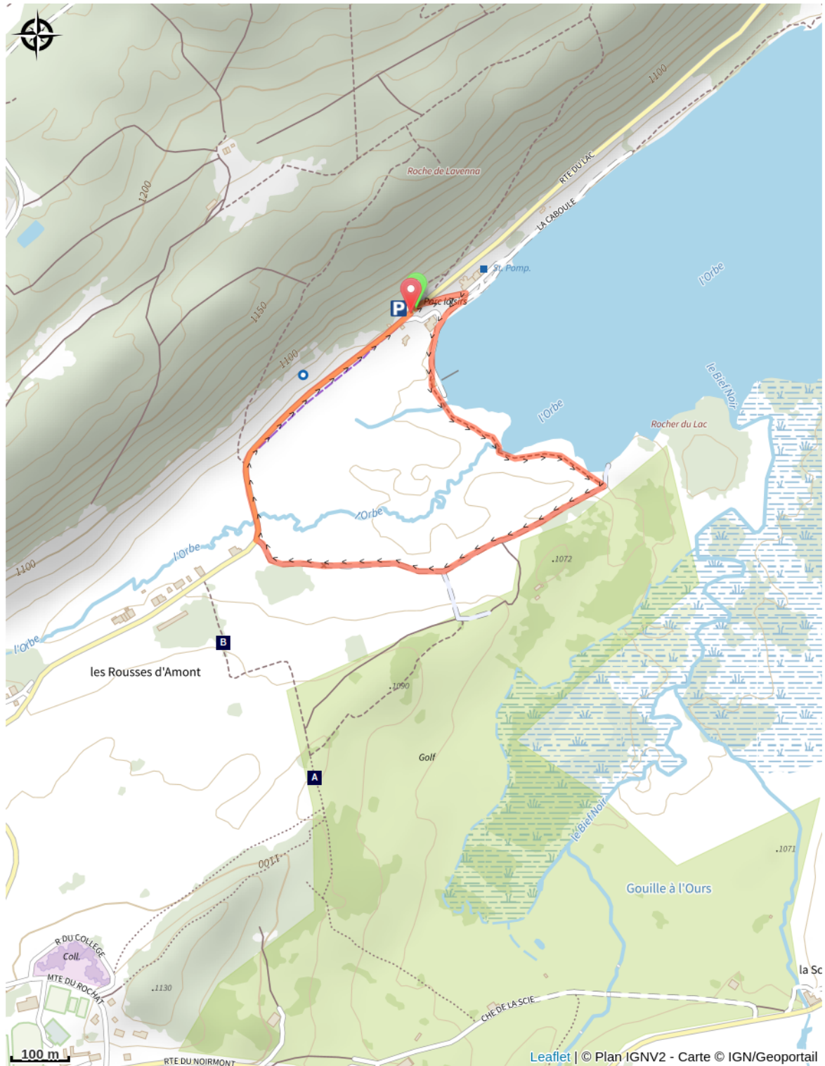
Étymologie des Rousses (A)