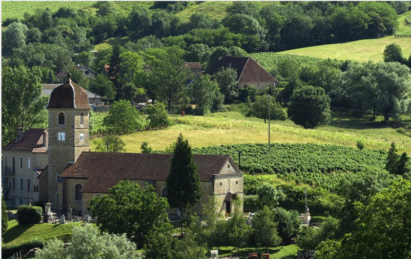
Village de l'Etoile et ses vignes