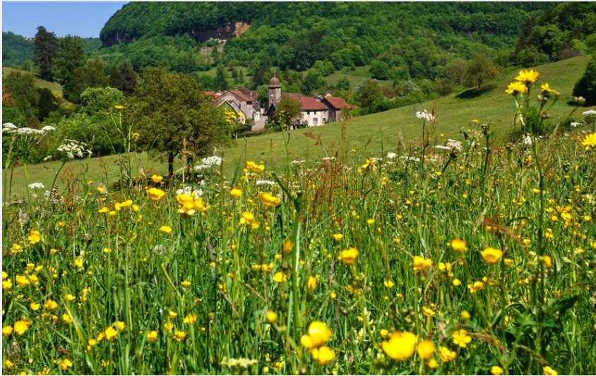
Village de Blois-sur-Seille