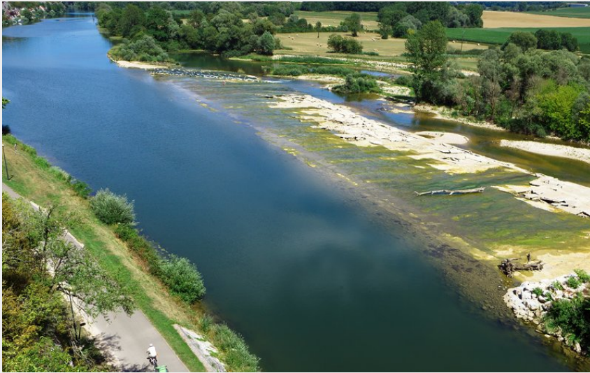
Canal du Rhône au Rhin depuis Rochefort sur Nennon