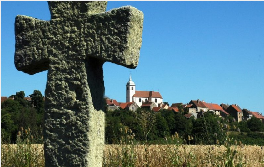
Croix pattées (© Henry Bertrand)