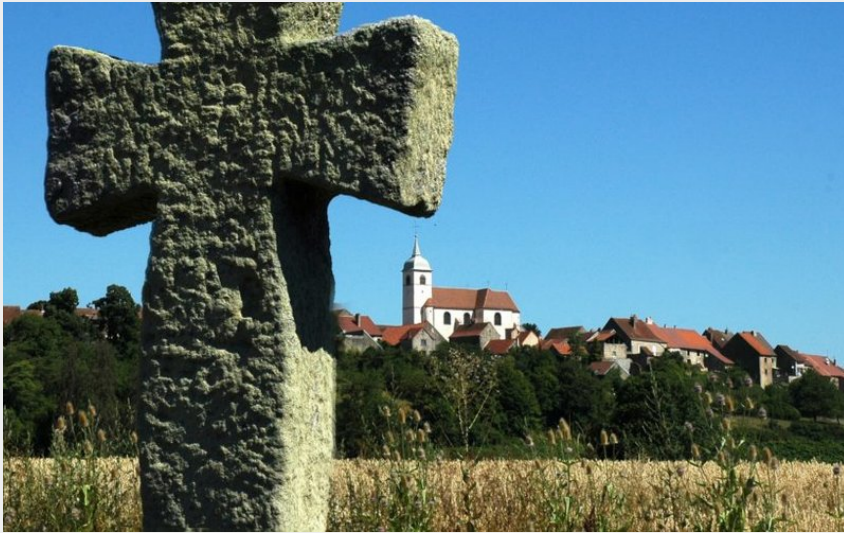
Croix pattées