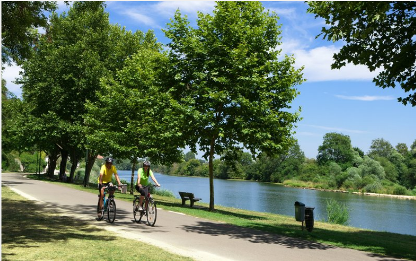
Cyclistes à Rochefort-sur-Nenon