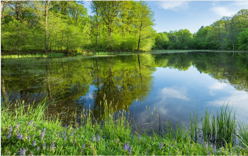
Etangs de la Bresse Jurassienne