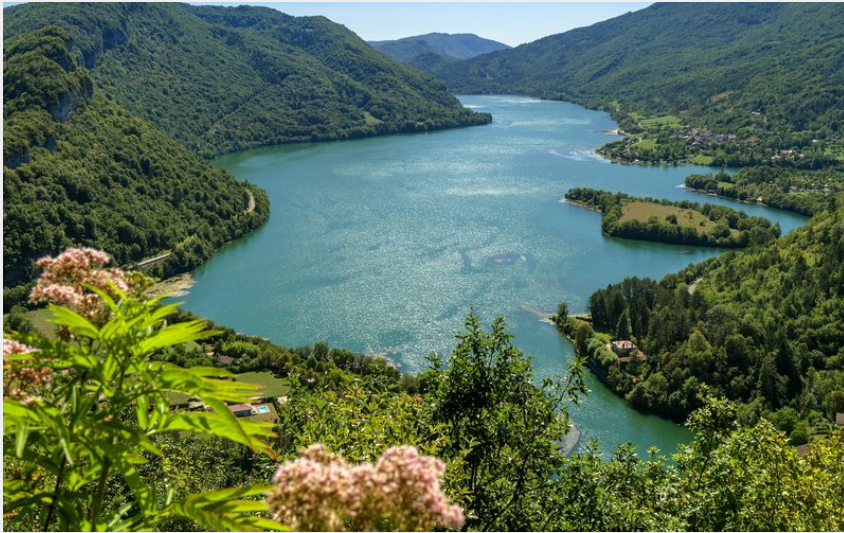
Lac de Coiselet depuis Montcusel