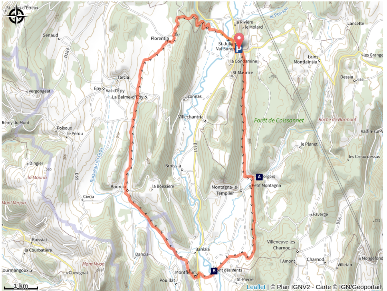
Le Moulin Burignat (A)