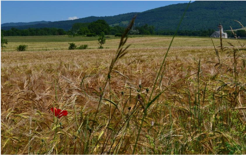
Paysage de la Petite Montagne