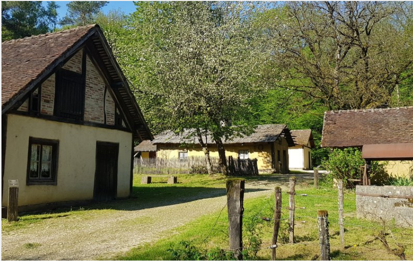
Forêt de Chaux - Baraque du 14