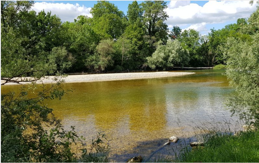
Ile du Girard