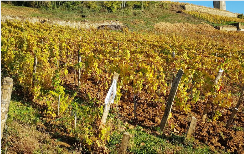
Vignes d'Arbois et Tour Curon