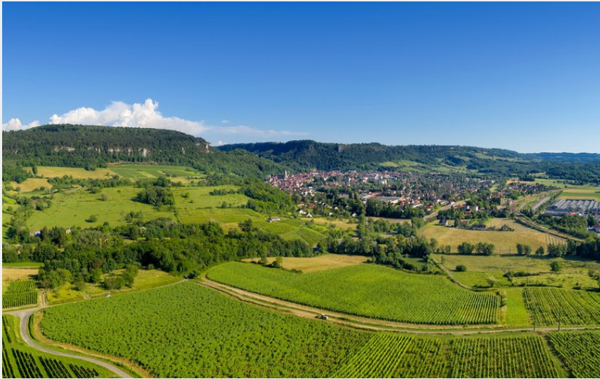
Poligny vue depuis les vignes