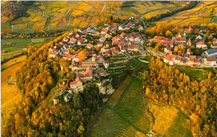
Village de Château-Chalon en Automne