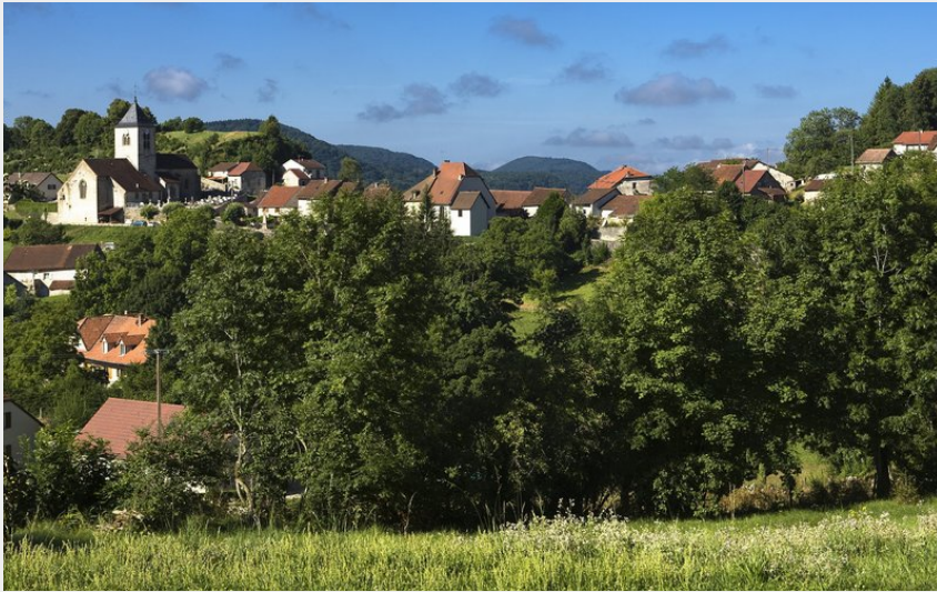
Village de Saint-Laurent-la-Roche