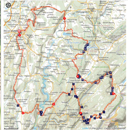
Montée des lacets de Septmoncel

Cette aventure, à l'assaut des Montagnes du Jura, emprunte les plus belles ascensions du département dans un décor naturel à couper le souffle. Vous cheminerez sur des petites routes, pour découvrir quelques-uns des plus grands sites du Jura. Entre la Petite Montagne aux influences méditerranéennes, le Vignoble et ses reculées majestueuses, la Station des Rousses à 1 200 m d'altitude en passant par l'impressionnant lac de Vouglans et son barrage, cette escapade à vélo, tout en diversité et en découverte séduira, à coup sûr, les amateurs d'itinérances sportives à vélo. Dépaysement garanti !