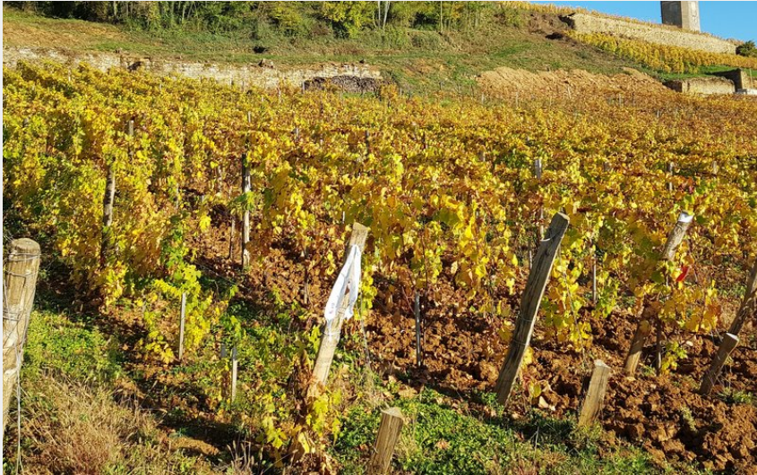
Tour de Curon dans les vignes d'arbois