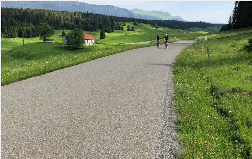
Cyclistes dans les Hautes-Combes