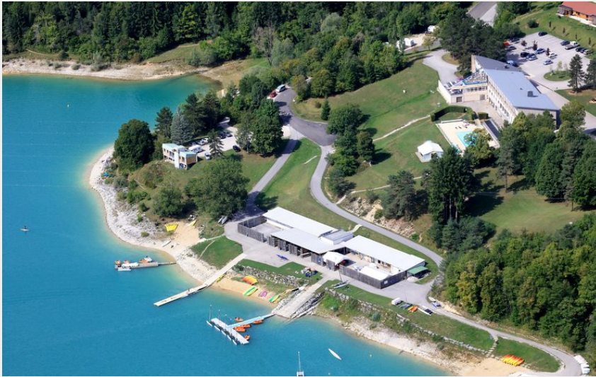
Centre sportif de Bellecin