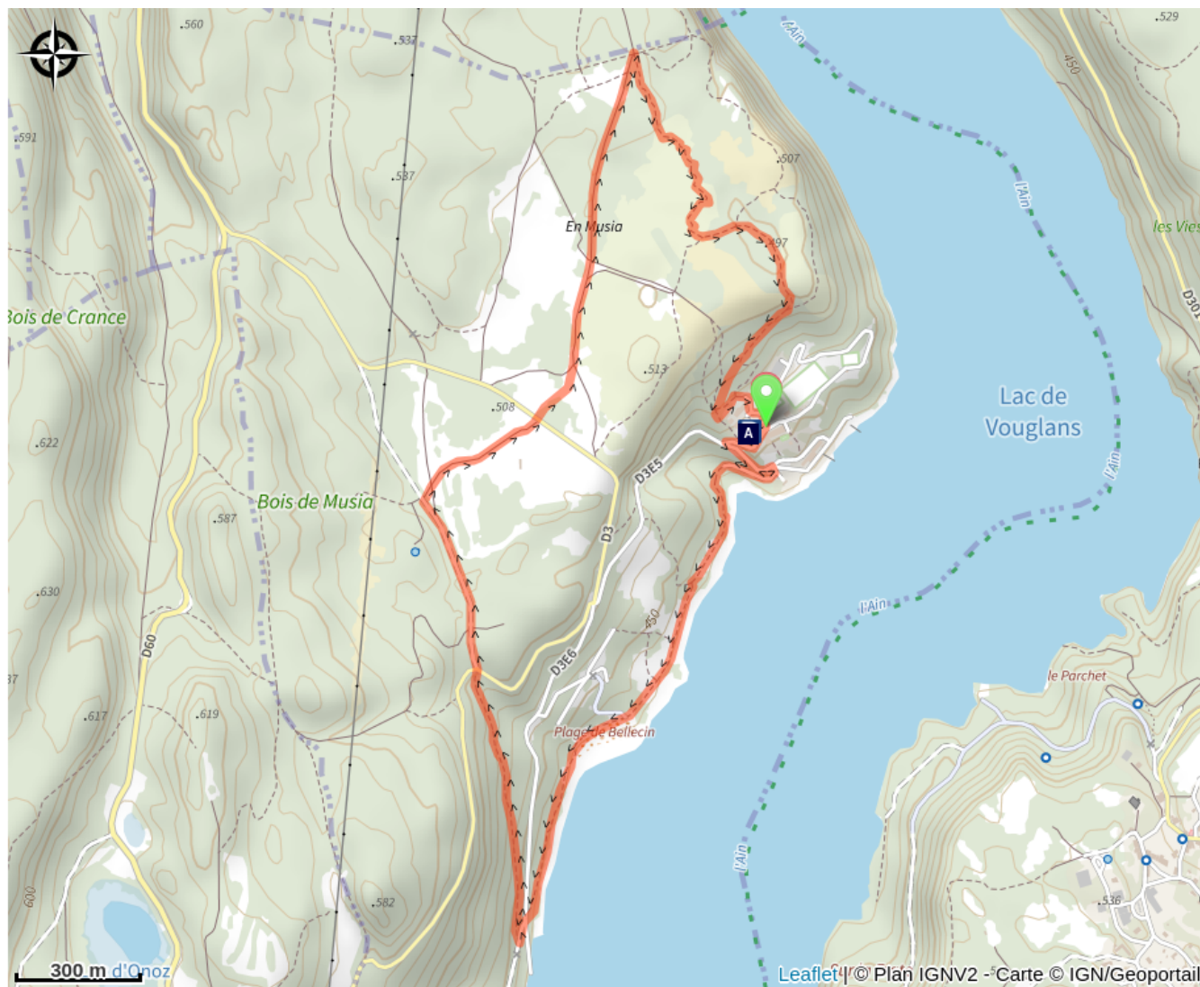
Base nautique de Bellecin (A)