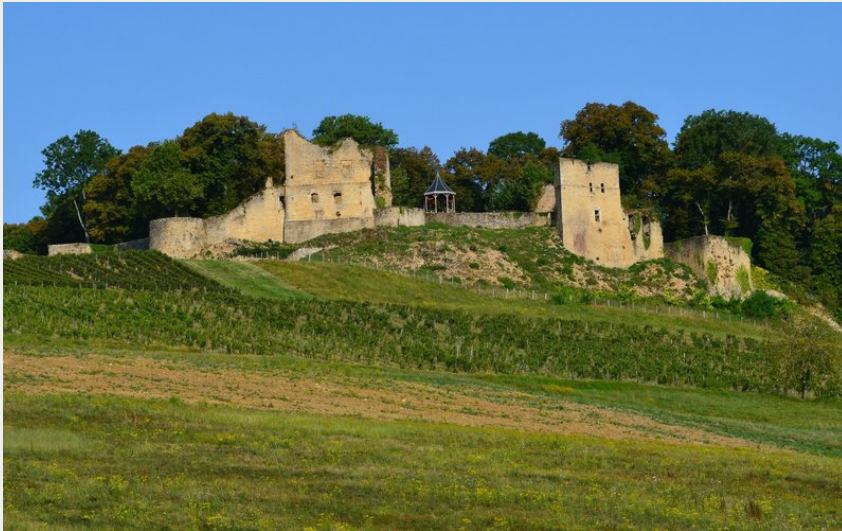
Chateau d'Arlay