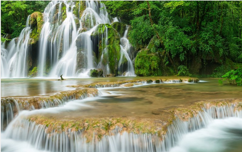
Cascades des tufs des Planches-Près-Arbois