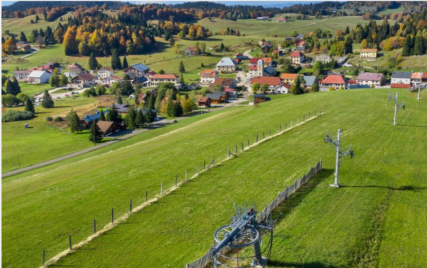
Village de La Pesse