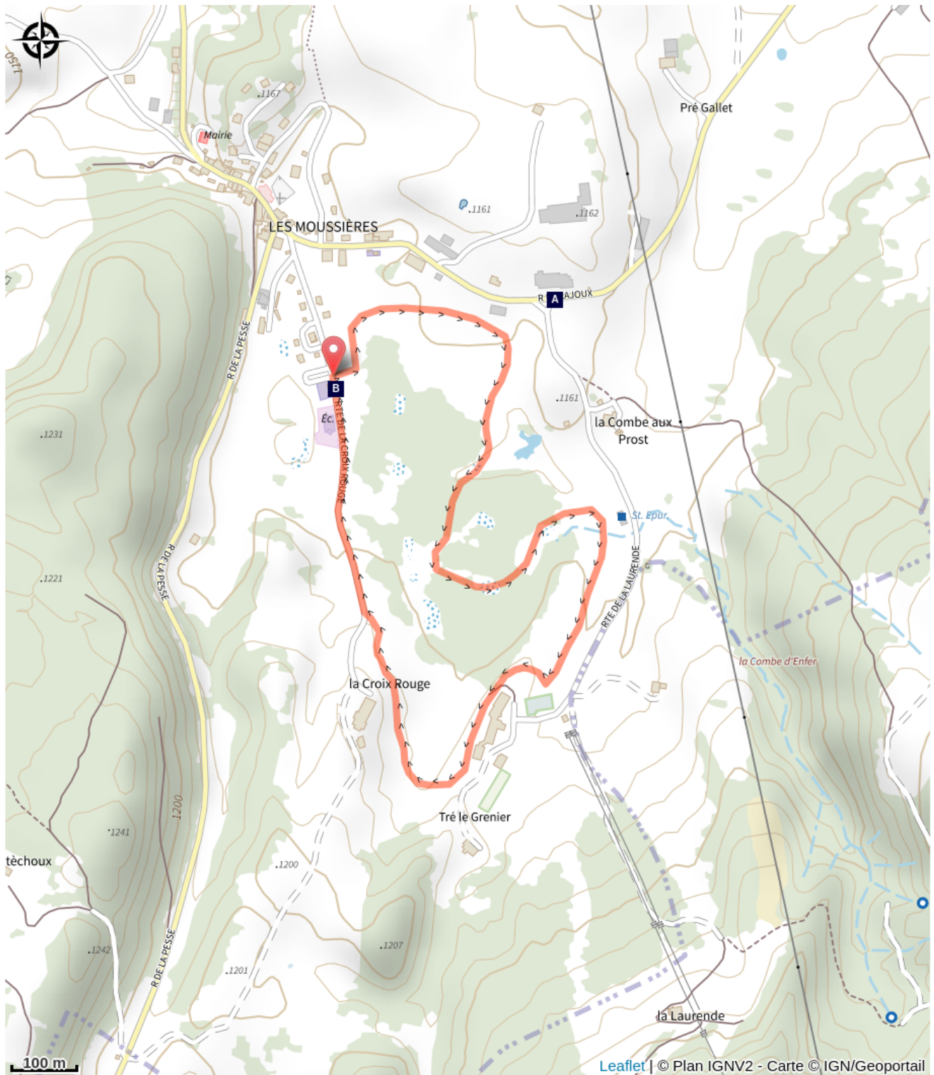
Fromagerie du Haut-Jura (A)