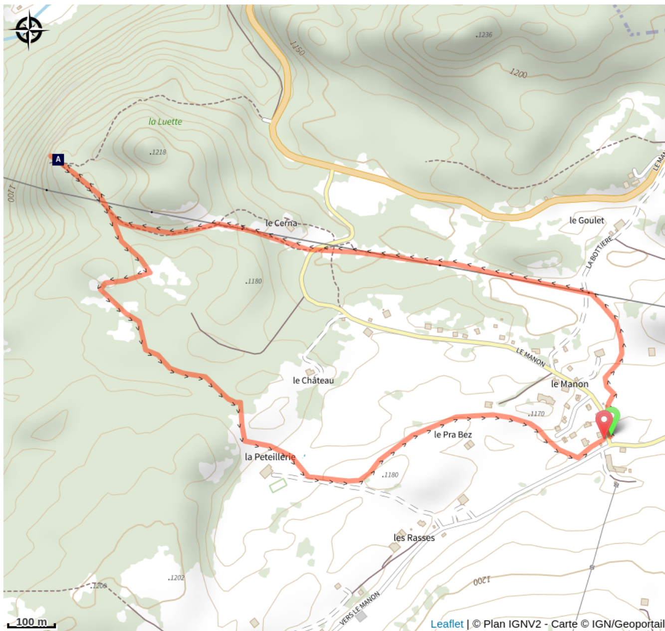
Point de vue de la Lvette (A)