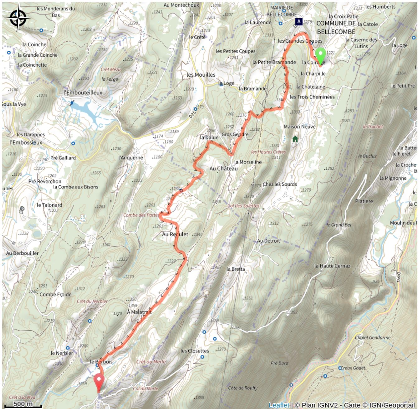
Mairie/école de Bellecombe (A)