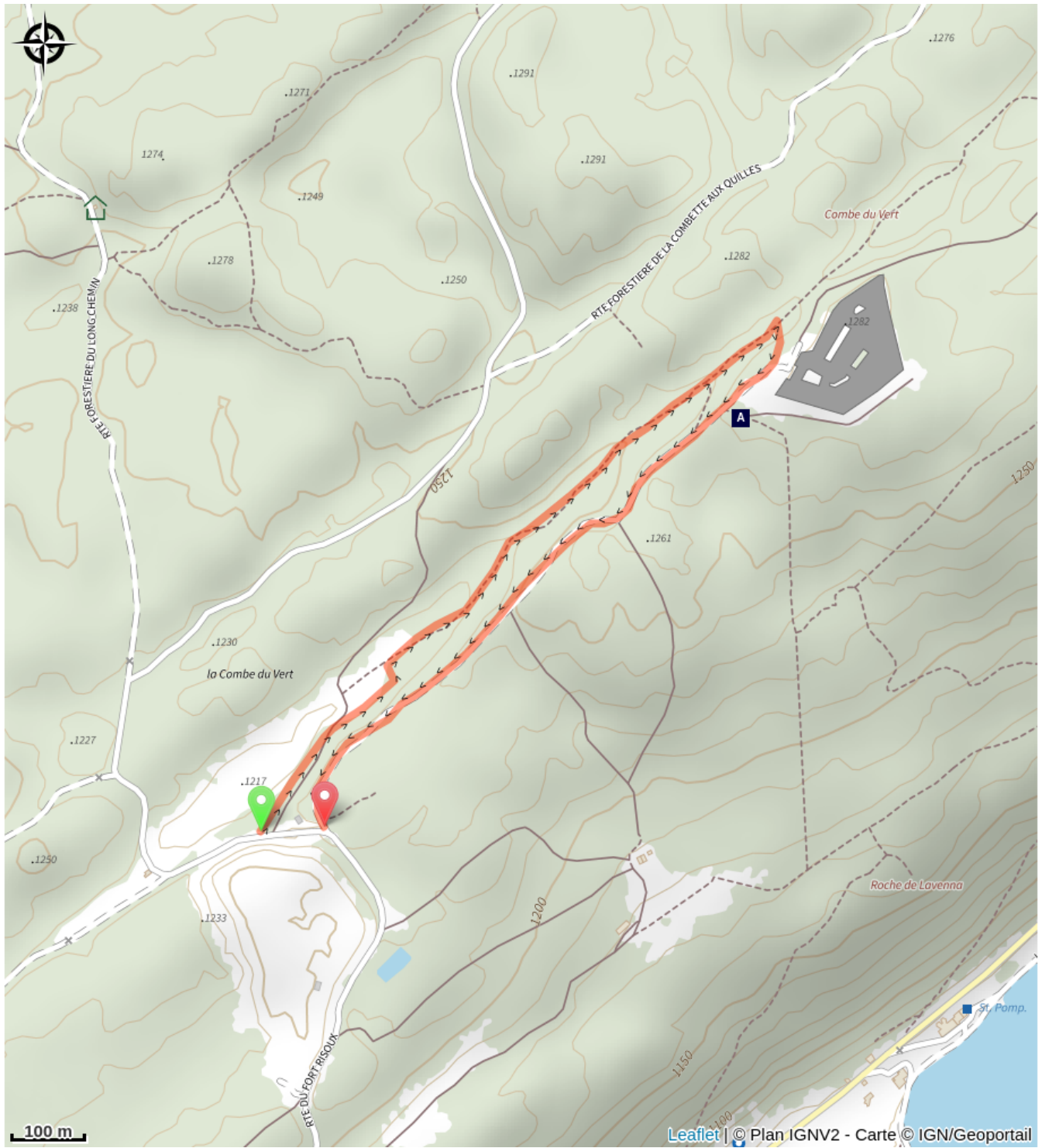
Le Fort du Risoux (A)