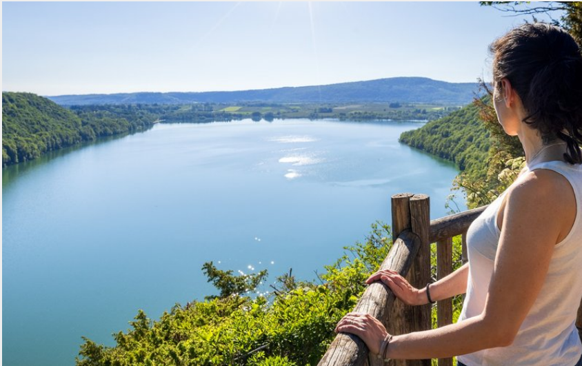
Randonneuse au belvédère de Fontenu