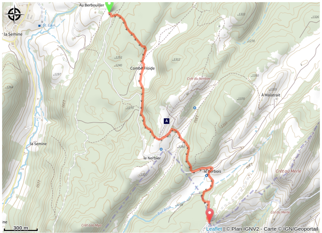
Le Col du Nerbier (A)